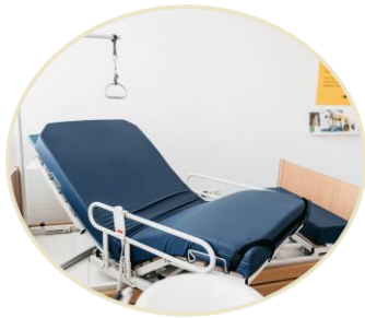
Lůžko s funkcí otočného roštu