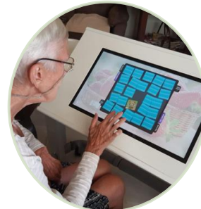
Interaktivní dotykový stolek