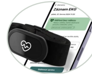
Hrudní pás s EKG snímačem