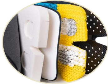
Antidekubitní sedák pro vozičkáře