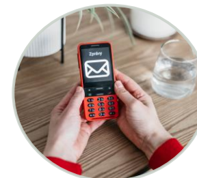
Mobilní telefon pro zrakově postižené