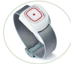
SOS tlačítka s lokátory GPS