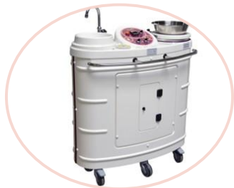
Mobilní sprchový systém