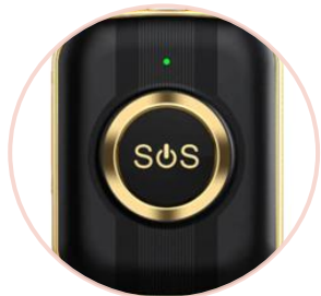
Služba tísňové péče